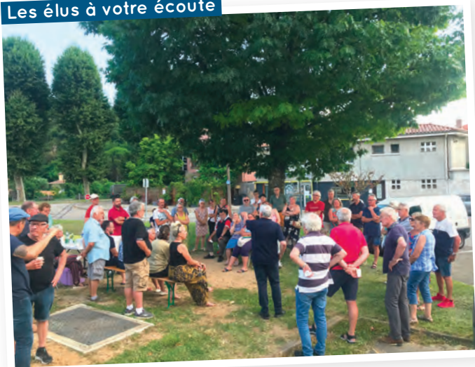
Les élus à votre écoute

Début juillet, des réunions ont été organisées dans plusieurs quartiers permettant aux citoyens de s'exprimer et aux élus de présenter les projets à venir.