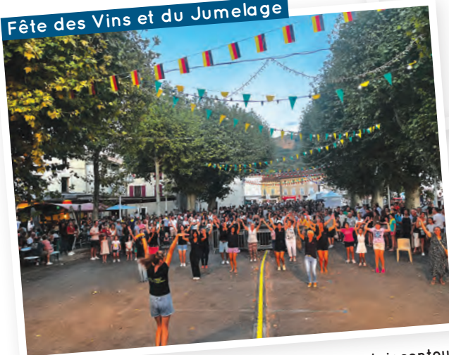
Fête des Vins et du Jumelage

Record de participation pour cet événement incontournable ! Des journées pleines de fête, de sport, de bonne humeur et de convivialité.