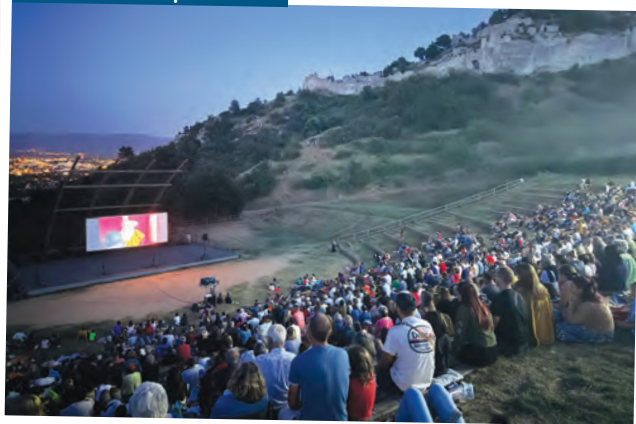
Cinéma de plein air

Le film d'animation Léo , produit par Foliascopes de Saint-Péray, a été mis à l'honneur au théâtre de verdure du château de Crussol. Un public nombreux a également pu apprécier la projection du film Antoinette dans les Cévennes .