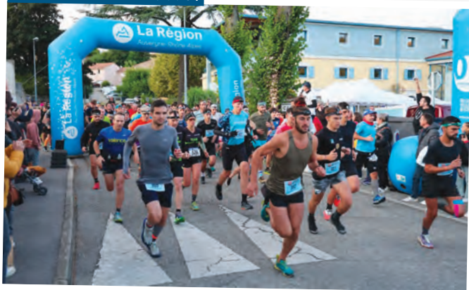
La ronde de Crussol

1100 coureurs motivés ont participé aux quatre courses organisées par le Macadam, un véritable succès sportif ! Un grand merci au club pour cette belle organisation qui met en valeur notre magnifique région.