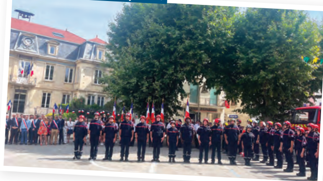
Cérémonie du 14 juillet

La fête nationale est l'occasion de mettre à l'honneur ceux qui œuvrent pour la défense de notre pays et de ses citoyens. Ce fut le cas pour de nombreux pompiers, professionnels ou volontaires, dont l'engagement a été salué, mais aussi pour l'ensemble des policiers municipaux et nationaux ainsi que les militaires.